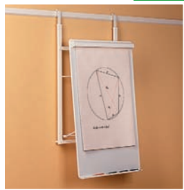
Flipchart de luxe