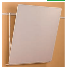
Projektionsfläche (130 x 130 cm, 150 x 150 cm, 180 x 180 cm)