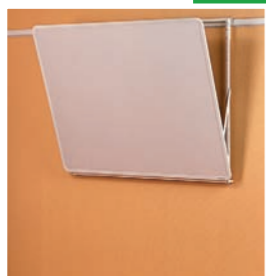
LCD-Projektionsfläche (B x H 150 x 110 cm, 173 x 130 cm, 150 x 150 cm, 200 x 150 cm, 240 x 180 cm)

Weiterhin sind noch folgende Produkte im Sortiment enthalten: Compactleiste, Prospekthalter, Leinwand (ausrollbar), verschiedene Regale und Moderatorentafeln!